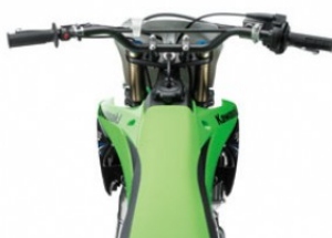
Cadre périmétrique en acier haute résistance