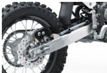
Suspension arrière Uni-Trak