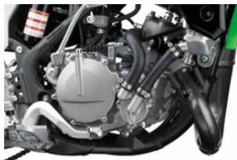
Monocylindre 2 temps plus puissant