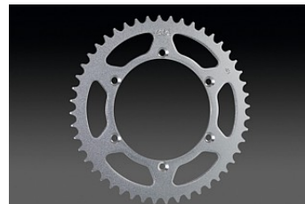
PIGNON ARRIÈRE EN ACIER € 34,95