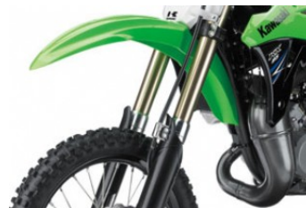
Fourche inversée de 36 mm