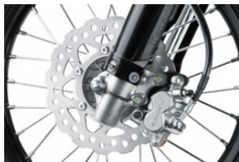
Disques de frein en pétales