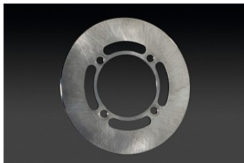
DISQUE PLEIN à partir de € 123,65